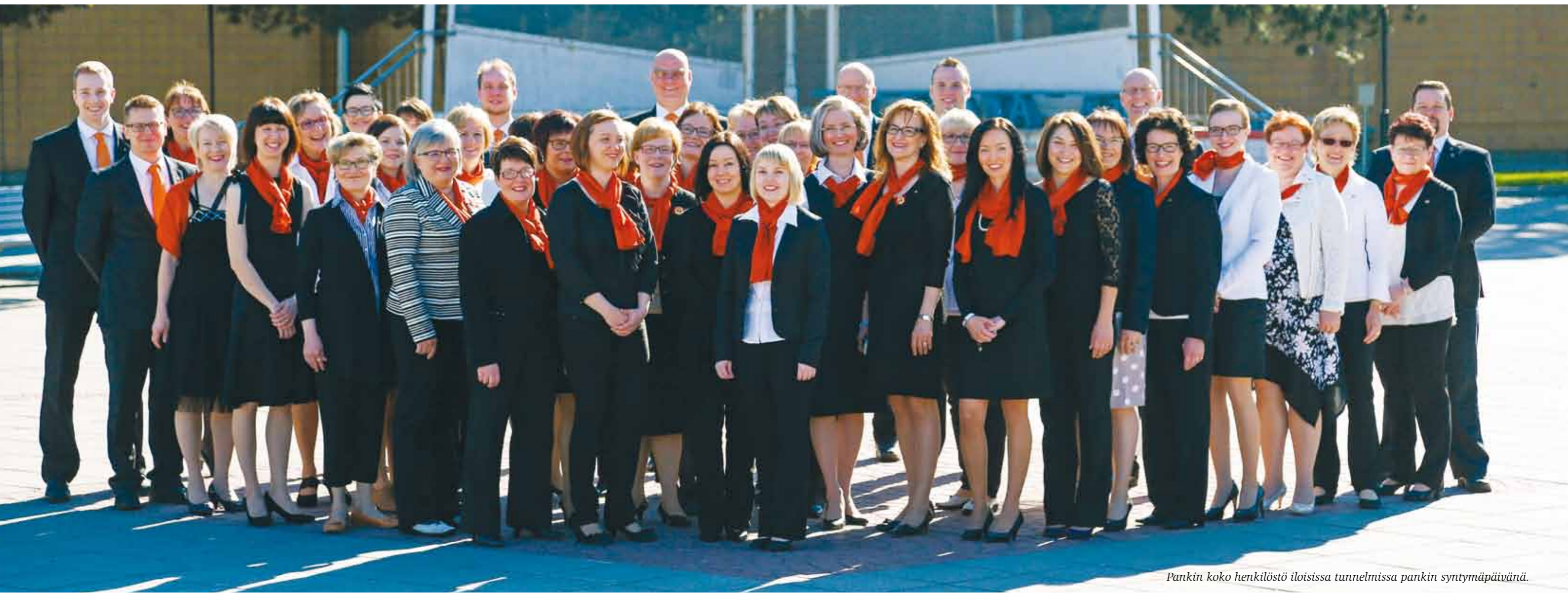
Pankin koko henkilöstö iloisissa tunnelmissa pankin syntymäpäivänä.