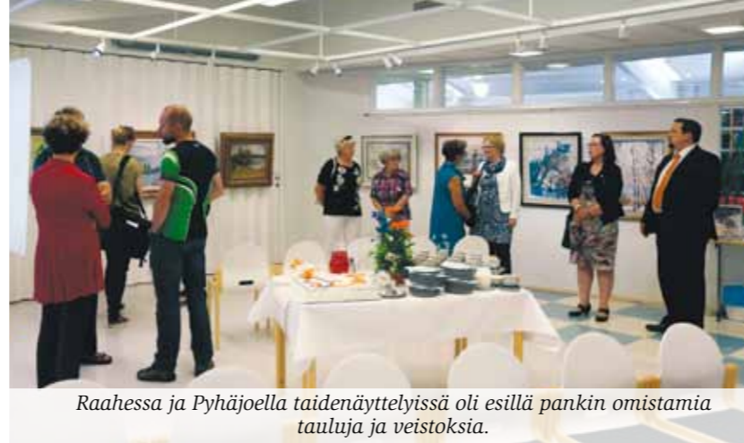
Raahessa ja Pyhäjoella taidenäyttelyissä oli esillä pankin omistamia tauluja ja veistoksia.