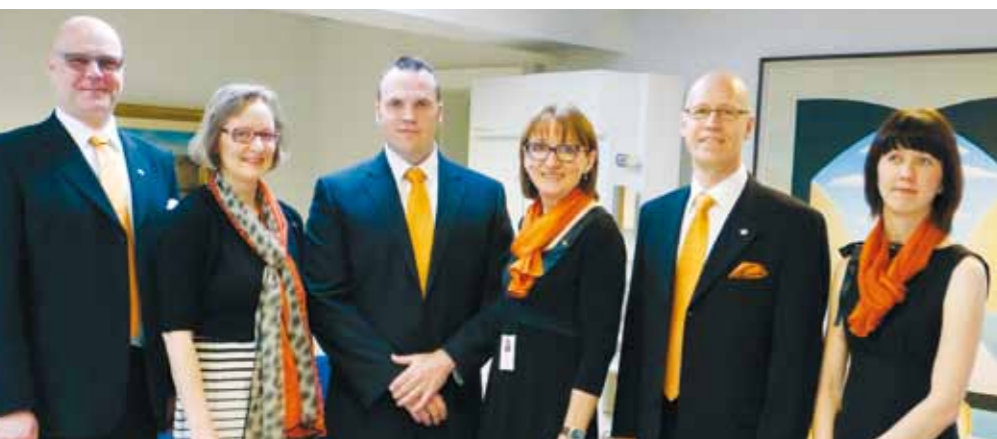
Pankin johtoryhmä ja esimiehet