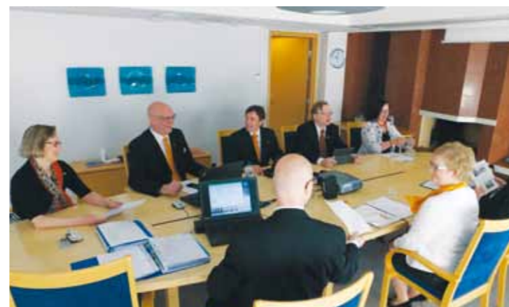
Hallitus ja esittelijät pankin 100-vuotisjuhlakokouksessa