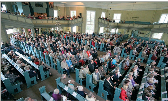
KIITOS. Juhlakonsertti oli kiitos kaikille asiakkaille, jotka ovat olleet mukana rakentamassa pankin menestystä vuosien varrella.