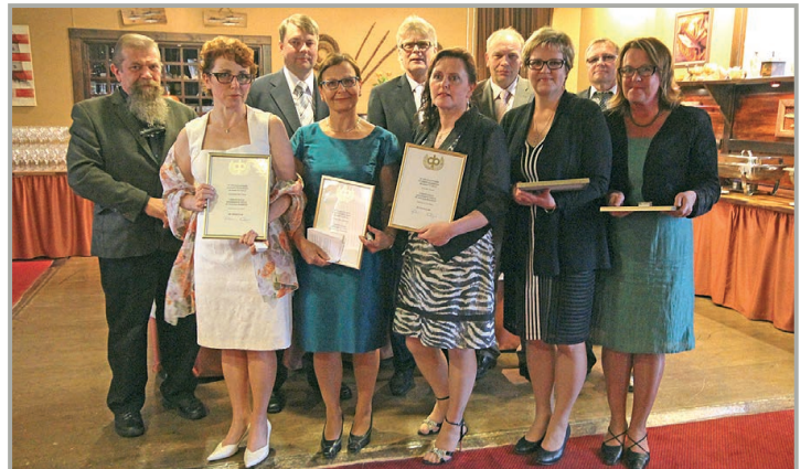
ANSIOMERKIT. Kultaisia ja hopeisia ansiomerkkejä pitkistä pankkiurista jaettiin sekä hallinnolle että henkilökunnalle.