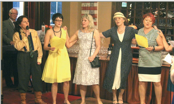
KEVENNYS. Henkilökunnan pankkiaiheinen sketsiesitys sai hallinnon juhlassa iloisen vastaanoton.