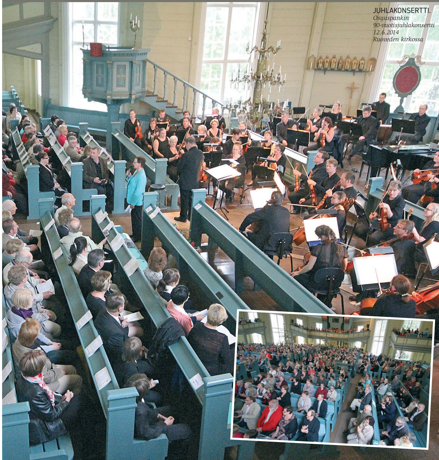
JUHLAKONSERTTI. Osuuspankin 90-vuotisjuhlakonsertti 12.6.2014 Ruoveden kirkossa

Ruoveden Osuuspankki jakoi vuonna 2013 bonuksia omistajajäsenille yli 498.000 euroa. Tervetuloa asiakkaaksemme!