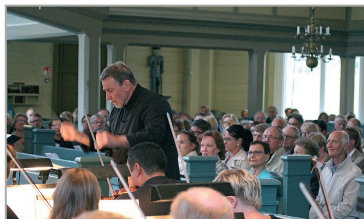
JUHLAKONSERTTI. Kapellimestari Okko Kamu johti Tampere Filharmoniaa pankin juhlakonsertissa 12.6.2014.