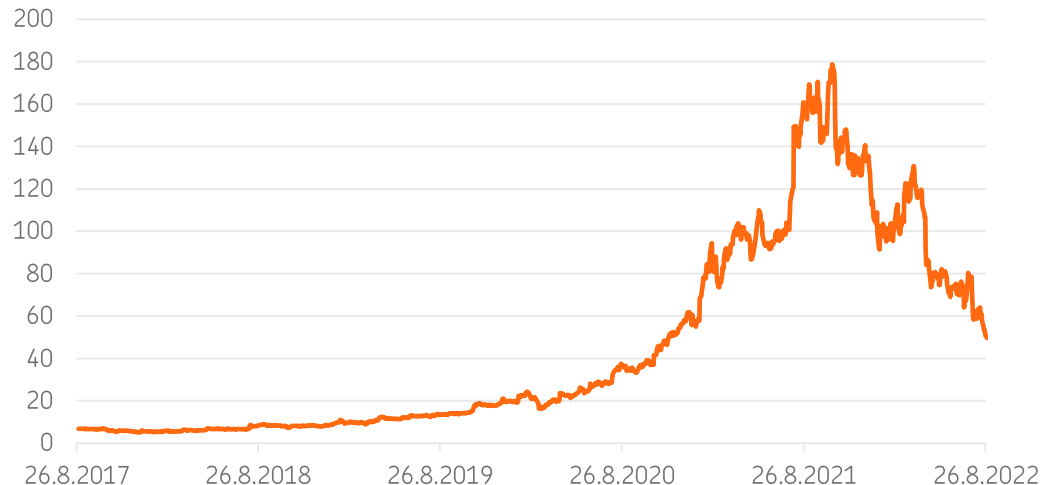
Qt Group kurssikehitys 26.8.2017 - 26.8.2022

Yhtiö on kasvanut viime vuosina voimakkaasti. Viimeisen viiden vuoden aikana yhtiön liikevaihdon vuosittainen kasvu on ollut lähes 35 %. Vuonna 2021 yhtiö teki 121 miljoonan liikevaihdolla lähes 29 miljoonaa euroa liikevoittoa.