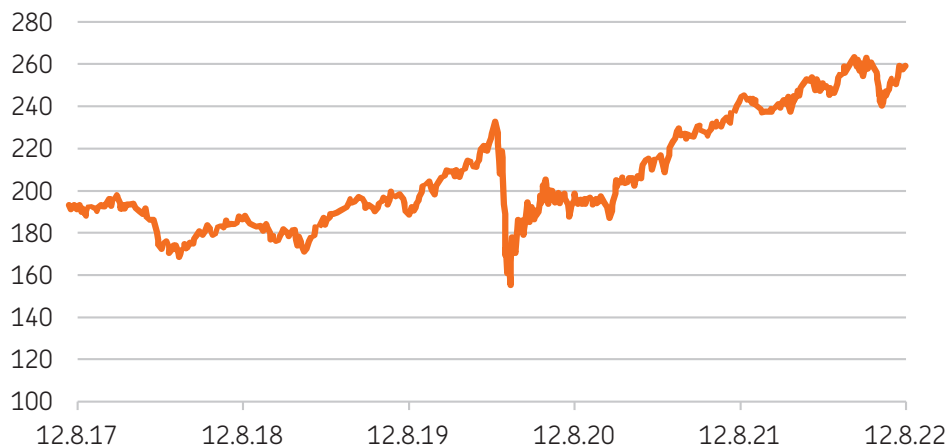
Kursutvecklingen för aktieindexet som utgör underliggande tillgång 12.8.2017–12.8.2022

Kursutvecklingsgrafiken åskådliggör den historiska värdeutvecklingen för Aktieindexet som utgör underliggande tillgång under de fem föregående åren. Den historiska utvecklingen är ingen garanti för den framtida utvecklingen.