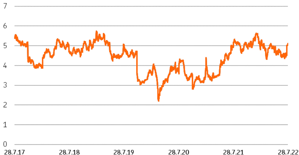
Nokia Oyj kurssikehitys 28.07.2017–28.07.2022

Företagets omsättning uppgick 2021 till 22,2 miljarder euro och företaget har verksamhet i cirka 130 länder och totalt cirka 88 000 anställda. Nokia har på 2000-talet varit en betydande teknikutvecklare, företagets kumulativa FoU-investeringar uppgår under de 20 senaste åren till cirka 129 miljarder euro, vilket betyder att företaget har bl.a. mer än 4 000 viktiga 5G-patenter.