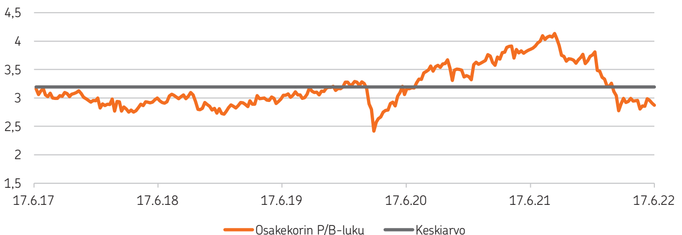
Kohde-etuusosakekorin P/B-luku 17.6.2017 – 17.6.2022

Osakekorin arvostus näyttää houkuttelevalta myös tasepohjaisella P/B-luvulla arvioituna. P/B-luku suhteuttaa yhtiön omaisuuserien nettoarvon osakkeen hintaan. Matalampi luku tarkoittaa, että sijoittaja saa ostettua osuuden yhtiön omaisuuseristä edullisemmin. Alla olevassa kuvaajassa oranssi viiva kuvaa osakekorin P/B-lukua ja harmaa viiva edellisen viiden vuoden keskiarvoa. Kuvaajasta nähdään, että kohde-etuusosakekorin tasepohjainen arvostus on laskenut jo edellisen vuosien keskiarvon alapuolelle.